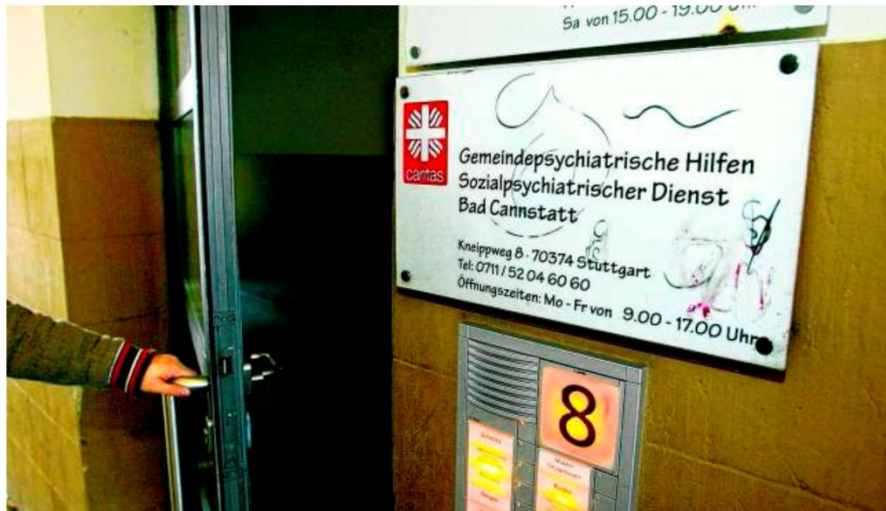
Im ganzen Land stehen den Hilfesuchenden die Türen der Sozialpsychiatrischen Dienste offen.

Andere Signale kommen von der neuen grün-roten Regierung: Im Koalitionsvertrag ist festgehalten, dass „das Hilfesystem so ausgestattet werden soll, dass ein verlässliches, strukturell aufeinander abgestimmtes System der komplementären, ambulanten und stationären Versorgung entsteht, in der die Grundversorgungs verpflichtung der Sozialpsychiatrischen Dienste ein wichtiger Bestandteil ist“. Stabilität soll vor allem von einem längst überfälligen Landespsychiatriegesetz kommen, in dem auch